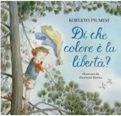
Figure Di che colore è la libertà? - Ragazzi Mondadori

Roberto Piumini - Libri Per Bambini , Risultati · Lo stralisco. Ediz. a colori · Lo stralisco. Ediz. a colori · Cuore d'eroe: La storia di Enea · Cuore d'eroe: La storia di Enea · Dei ed eroi dell' ... amazon.it/roberto-piumini-Libri-bambini/s?k=roberto+piumini&rh=n%3A508715031