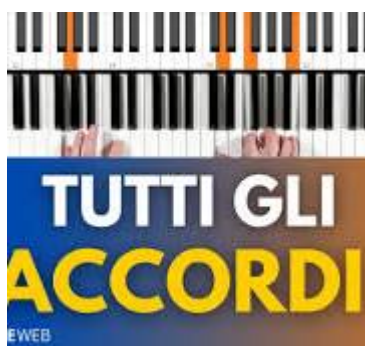
Figure ACCORDI AL PIANOFORTE: la guida completa

Come riconoscere gli accordi sullo spartito? Come riconoscere gli accordi sullo spartito? Se ci fai caso, quando cerchi gli accordi per pianoforte di una canzone su internet, trovi il testo della canzone con sopra scritte alcune lettere. Ecco, quelle lettere, apparentemente prive di significato, indicano gli accordi da suonare sul testo della canzone.