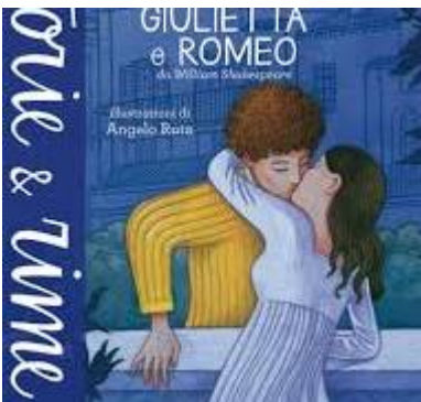
Figure Giulietta e Romeo

Roberto Piumini - Libri Per Bambini , Risultati · Lo stralisco. Ediz. a colori · Lo stralisco. Ediz. a colori · Cuore d'eroe: La storia di Enea · Cuore d'eroe: La storia di Enea · Dei ed eroi dell' ... amazon.it/roberto-piumini-Libri-bambini/s?k=roberto+piumini&rh=n%3A508715031