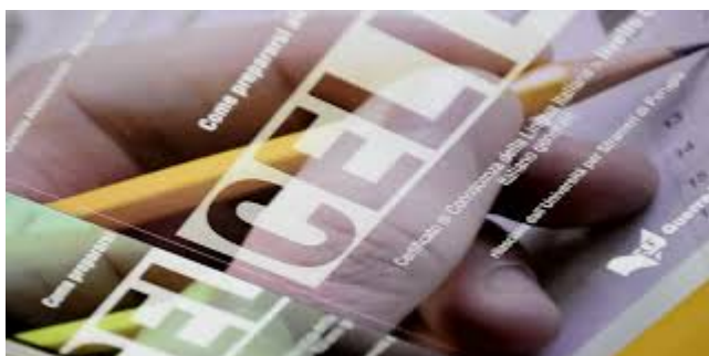
Figure CELI (Certificati di Lingua Italiana) | Università per ...

Quanto vale la certificazione B2? Le Certificazioni Linguistiche Il possesso di una certificazione linguistica è richiesto anche a docenti e aspiranti docenti, e il possesso del titolo viene riconosciuto come punteggio nelle Graduatorie Provinciali (GPS). La certificazione B2 conferisce 3 punti, la C1 4 punti e la C2 6 punti nelle GPS.