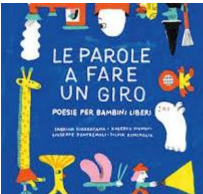
Figure HOEPLI.it >> Tutti i libri di piumini roberto

Piumini Roberto - edizioni Lapis , Ha composto una trentina di poemi su materiali espressivi e di ricerca di gruppi di ragazzi. Ha scritto molti testi per cori e opere musicali. È autore di ... edizionilapis.it/autore/0000000193-piumini-roberto#:~:text=Roberto Piumini%2C nato a Edolo,Milano e Buonconvento presso Siena